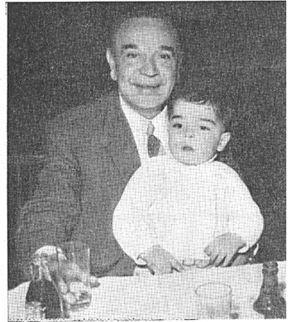
Con su nieto